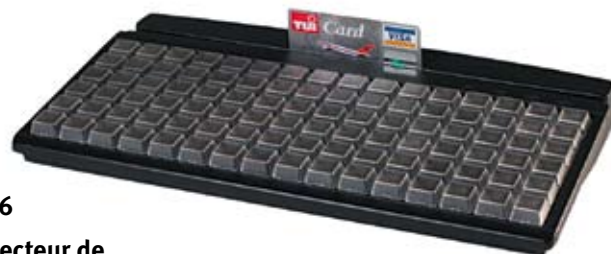
MCI 96 Avec lecteur de carte magnétique